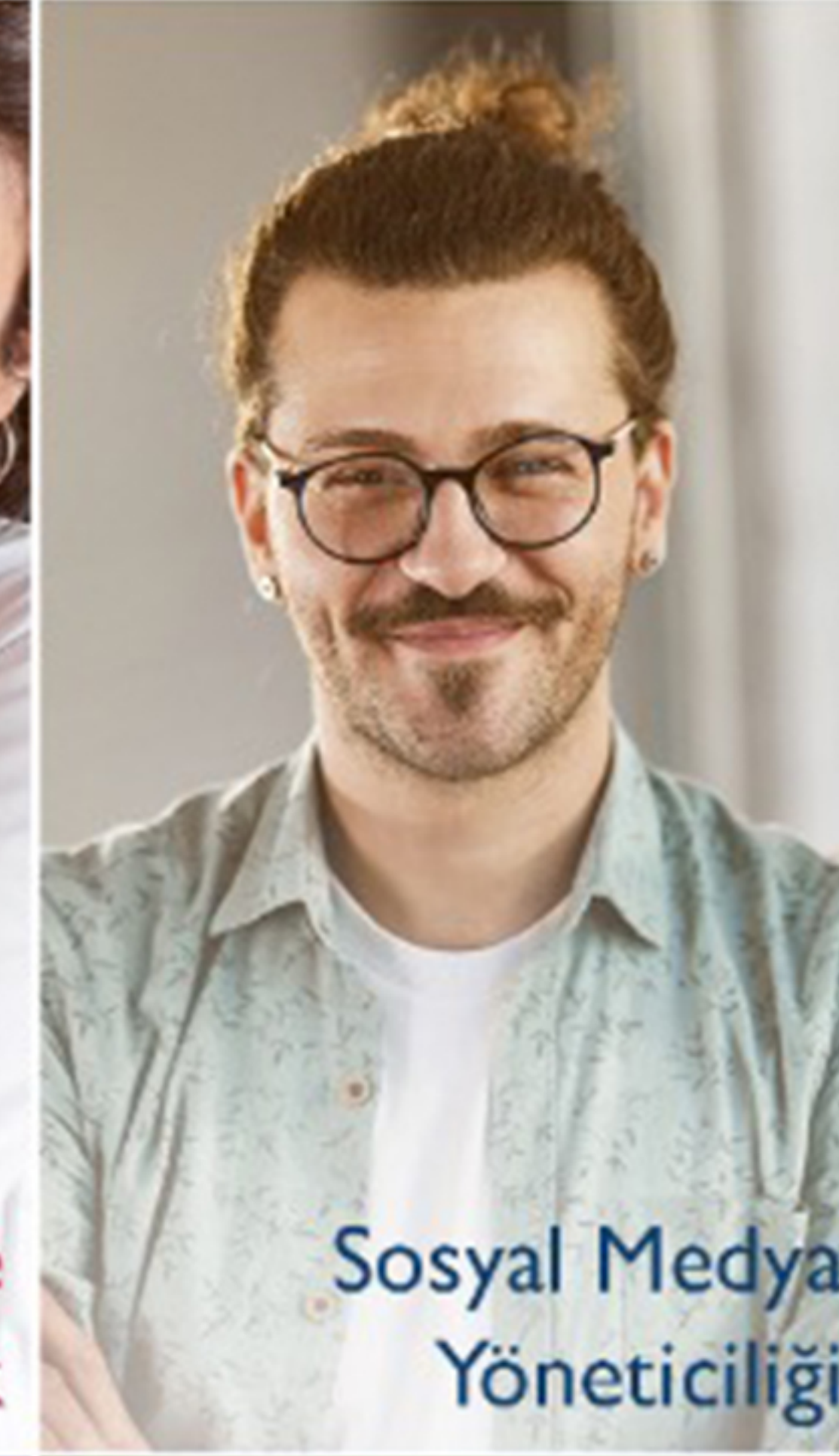
Sosyal Medya Yöneticiliği