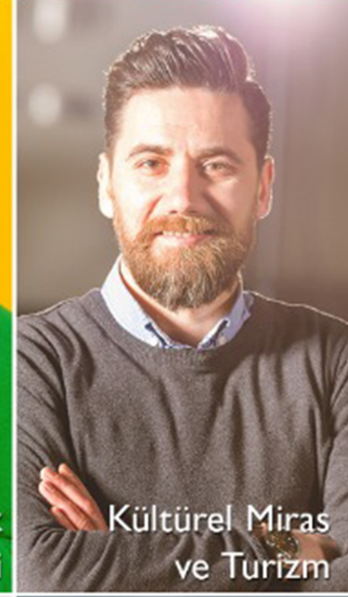
Kültürel Miras ve Turizm