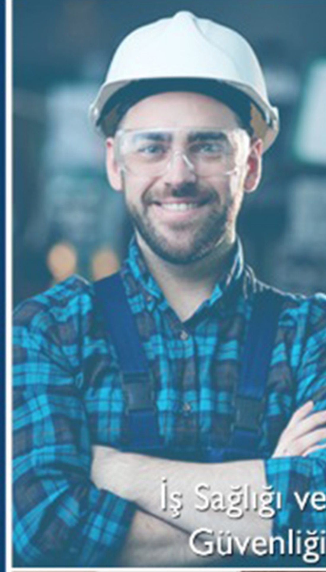
İş Sağlığı ve Güvenliği