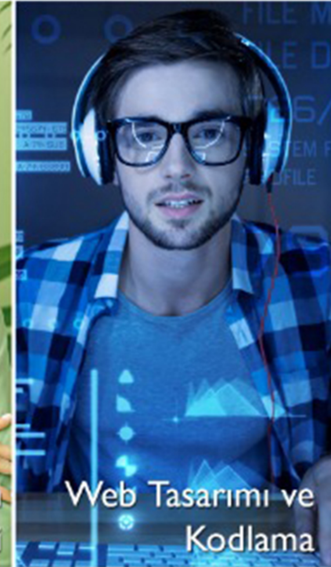
Web Tasarımı ve Kodlama