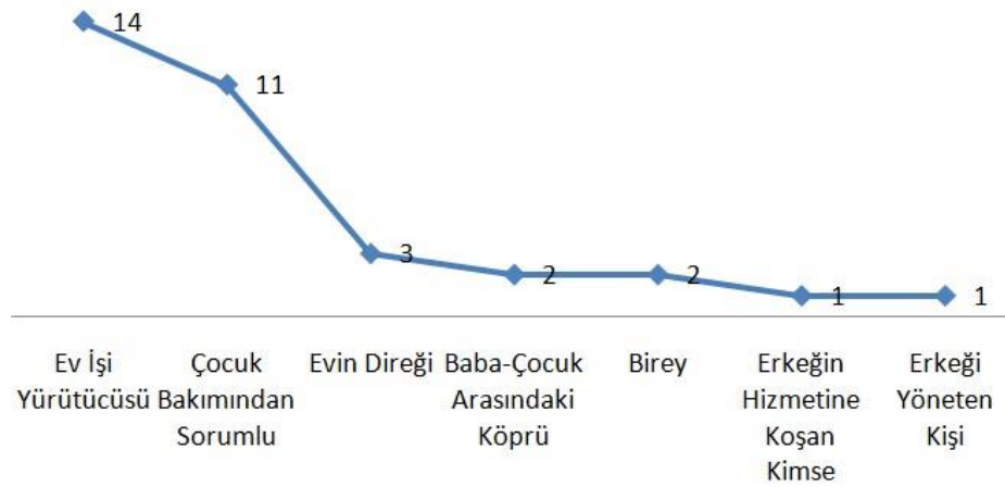
Aile içinde Kadın Kendini Ne Olarak Görüyor?

İkisi hariç katılımcıların tamamı kendi kimliklerini ev emeği ve bakım rejimi üzerinden kurmaktadır. Bu kurguda, evlilik öncesi aile yaşamının da etkisi vardır. Çünkü ev emeğinden kendisini sorumlu tutan kadınlar, çalışsalar da çalışmasalar da evlenmeden önce ev işleriyle ilgilendiklerini anlatmışlardı. Anneye yardım da etse bütün işleri kendi de üstlenmiş olsa aile içindeki kendi konumuna ilişkin mevcut algı sorumluluk anlayışına dayanmıştır. “Evin direği” nitelemesi öncelikle katılımcıların, ev emeğinin kendileri tarafından yürütülmesinin önemine vurgu yapmak için kullanılmıştır. Çünkü erkeğin bahsi geçen işleri ya yapamayacağı ya da yapmayacağı düşüncesiyle, bunların kadının sorumluluğunda olduğu düşünülmüştür. Bir katılımcı tarafından vurgulanan, “erkeğin hizmetine koşma” düşüncesi, erkek egemen ideolojiyi yeniden inşa etmektedir. Çünkü ev işi, çocuk bakımı gibi eylemler üzerinden kimlik kurulumunun yanında burada erkek üzerinden kurgulanan bir kadınlık söz konusudur.