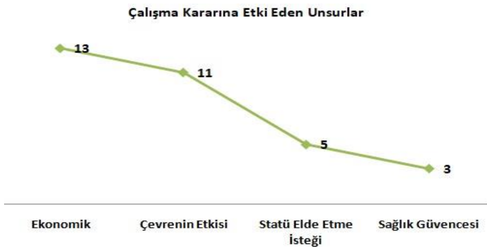
Grafik 3: Çalışma Kararına Etki Eden Unsurlar

Fabrikada çalışmaları yönündeki kararların öncelikle belli başlı etkiler doğrultusunda gerçekleştiğini belirtmem gerekiyor. Ekonomik gerekçeler, çevre faktörü, sosyalleşme ve sağlık güvencesi ihtiyacı, söz sahipliği veya statü elde etme istenci şeklinde çeşitlenen bu etkiler, katılımcıların yahut onlar adına verilen kararlarda pay sahibi olmuşlardır.