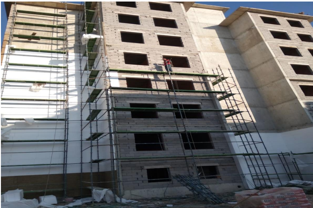
Resim 6: Dış cephede çalışan öğrencinin çalışma esnasında yakalanan bir kare (Yer: İstanbul)