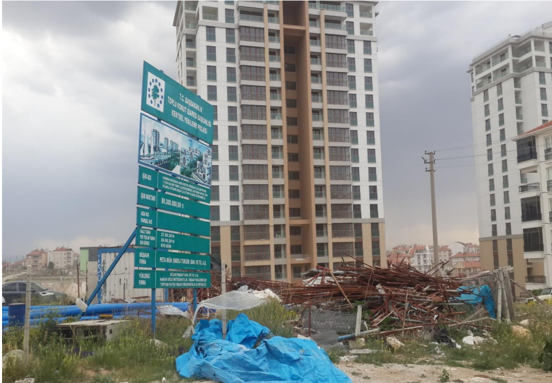
Resim 2: İnşaat sahasındaki bir blok (Yer: Karaman).