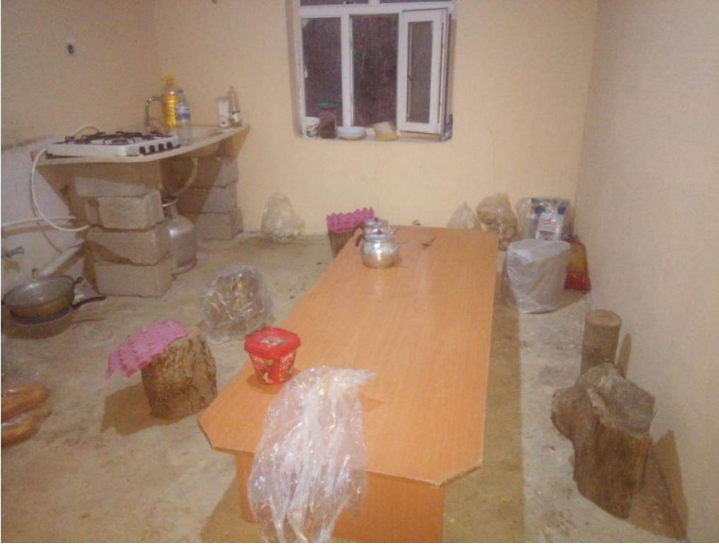
Resim 11: İnşaat sahasında bir odanın temizlenip, iş bitene kadar barınma yeri olarak ayarlanması. Mutfak olarak kullanılan bir odadan kare.