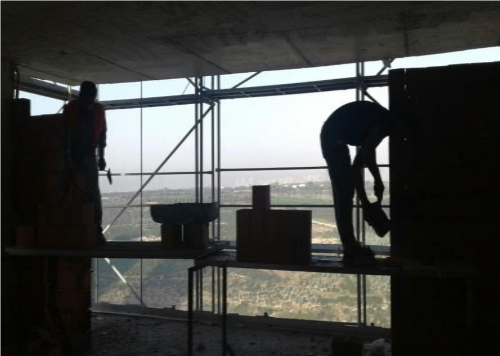
Resim 8: Çalışma saatleri içerisinde bir kare (Yer: İstanbul).