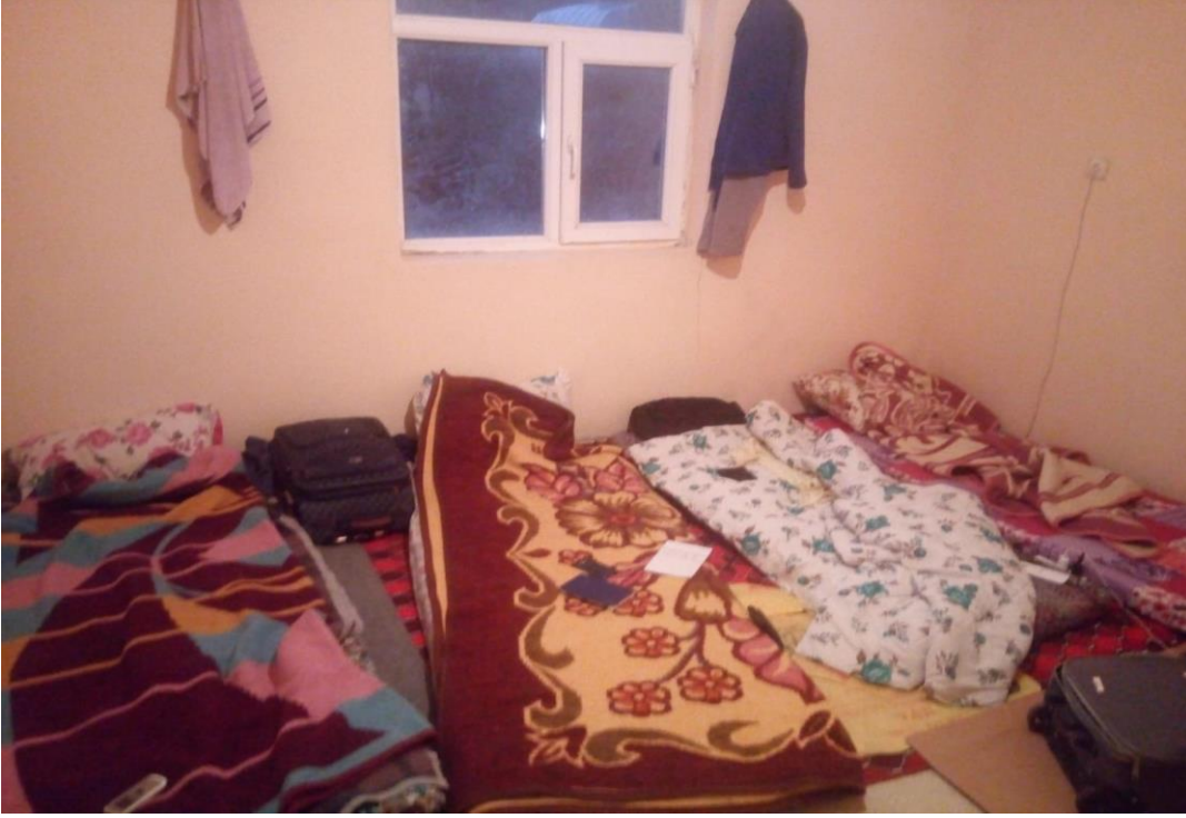
Resim 13: Yatak odası olarak kullanılan odadan bir kare.