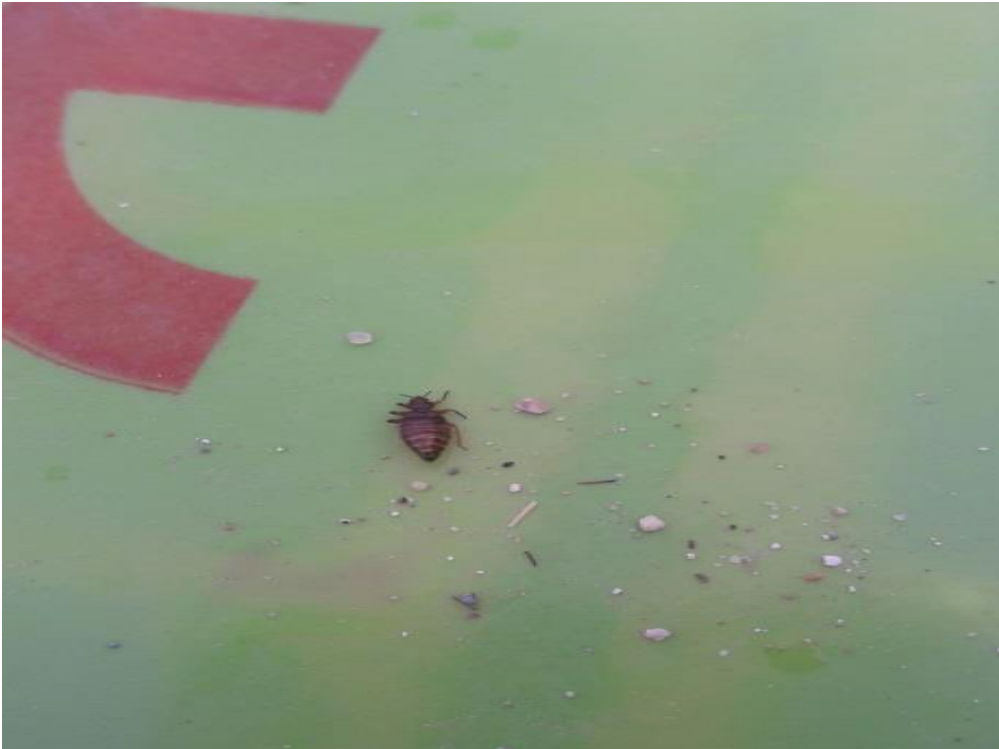
Resim 10: Yatak odasında bulunan bir tahtakurusu resmi.