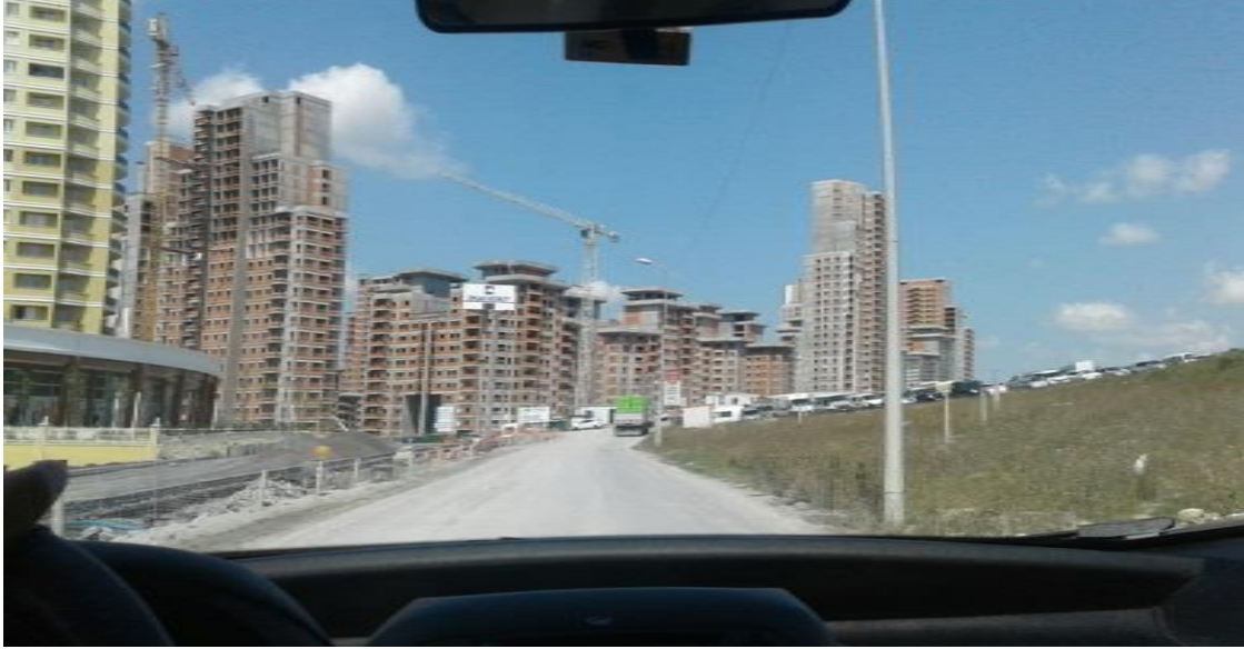
Resim 1: İnşaat sahasına ilk giriş yapılırken, genel görünümü yansıtan bir kare (Yer: İstanbul/Ataşehir).