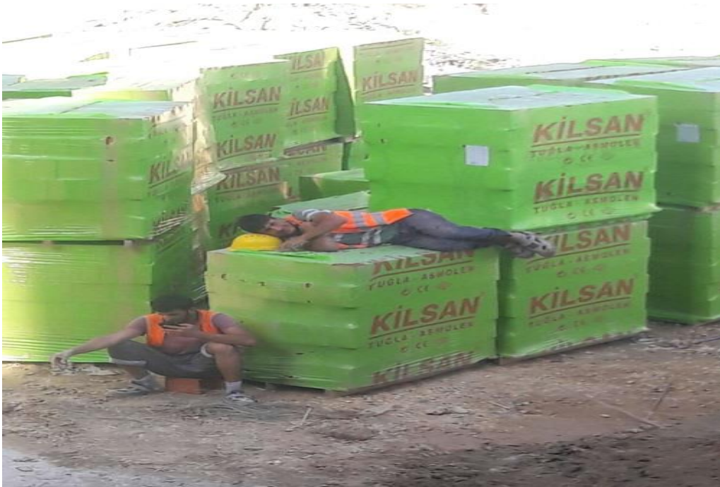
Resim 4: Öğrencilerin gün içinde mola saatinden yansıyan bir kare.