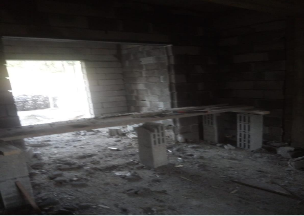
Resim 9: Şantiye sahası içerisinde bulunan bir daireden kare.