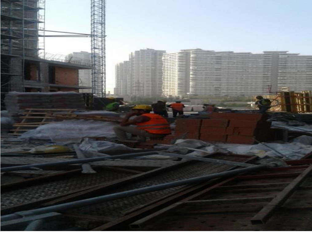
Resim 7: Mola saatleri içerisinde çekilen bir kare (Yer: İstanbul/Ataşehir).