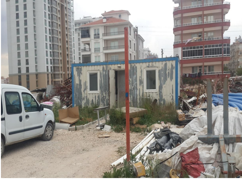
Resim 3: Çalışanların lavabo ve banyo olarak kullandıkları bir konteyner (Yer: Karaman).