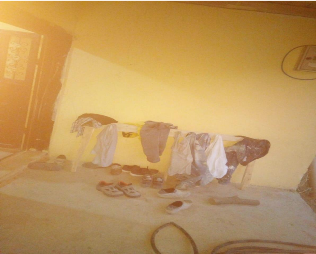
Resim 12: Temizlenen iş elbiselerinin kurutulmaya çalışıldığını yansıtan bir kare.