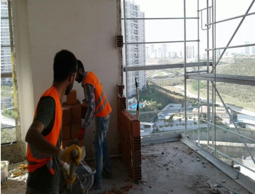
Resim 5: Çalışma saatleri içerisinde şantiyeden yansıyan bir kare (Yer: İstanbul/Ataşehir).