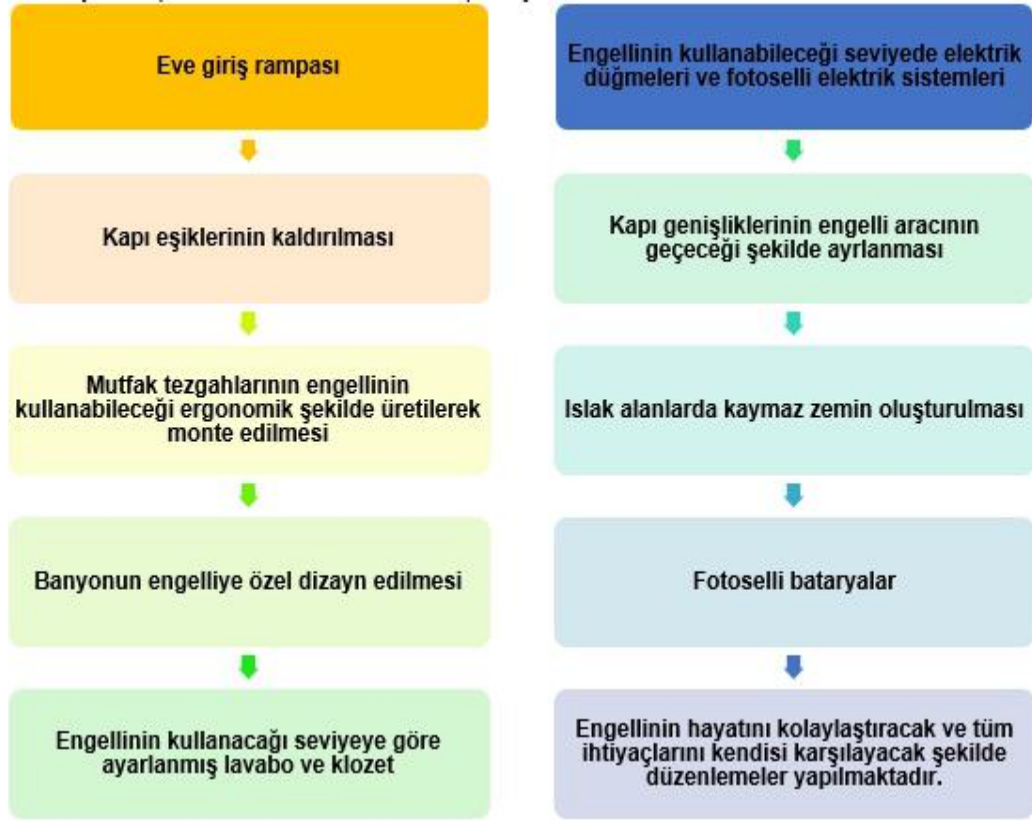
Şekil 2: Engelsiz Mekanlar/Yapılan Mekanlar (2018)

Kaynak: Konya Büyükşehir Belediyesi Faaliyet Raporu 2018: 213.