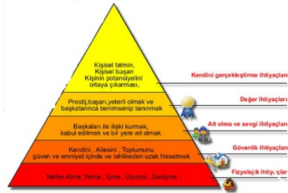
Şekil 1. Maslow'un ihtiyaç teorisi