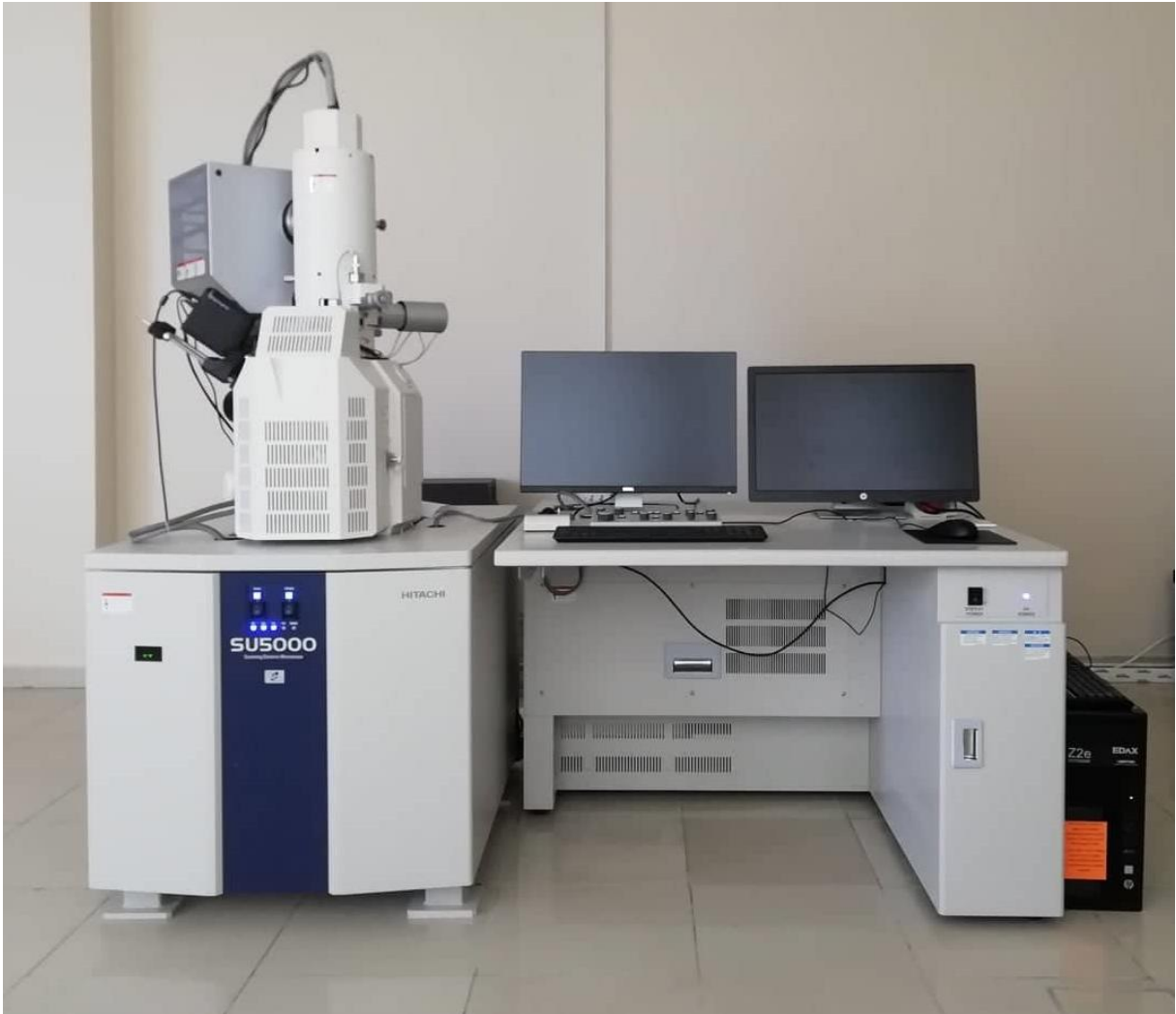
Hitachi Marka Taramalı Elektron Mikroskobu

Üniversitemiz ve Merkezimiz araştırma altyapısına büyük oranda katkı sunacak olan Taramalı Elektron Mikroskobu (SEM) 2018 yılında Rektörlüğümüz (İdari ve Mali İşler Daire Başkanlığı) tarafından satın alması gerçekleştirilmiş olup Merkezimiz bünyesinde cihaza özel laboratuvar oluşturularak kurulumu tamamlanmıştır. 2019 yılından itibaren aktif olarak hizmet vermeye başlayacaktır.