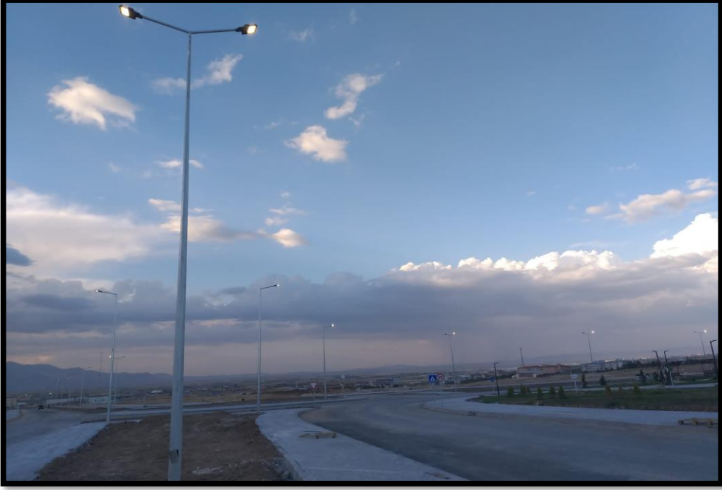
KMÜ Güney Giriş Kapısı, Kaldırım, Refüj ve Yol Aydınlatma Yapım İşi Görsele