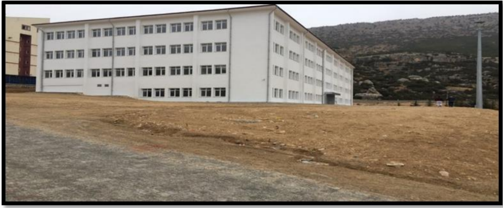
Uysal ve Hasan Kalan Sağlık Hizmetleri MYO Çevre Düzenleme Görselleri