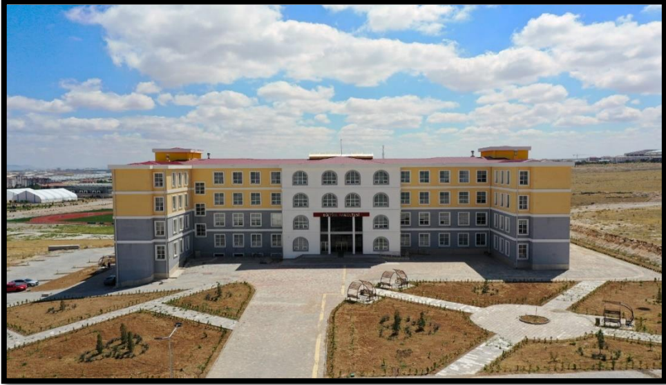
Eđitim Fakóltesi evre Dúzenleme alıřmaları