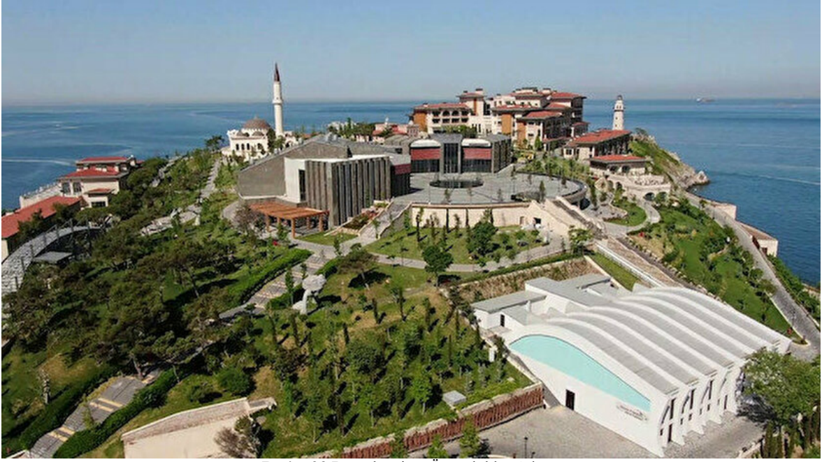
Resim 23 Demokrasi ve Özgürlükler Adası

https://www.yenisafak.com/gundem/demokrasi-ve-ozgurlukler-adasi-27-mayisa-hazir-3634950