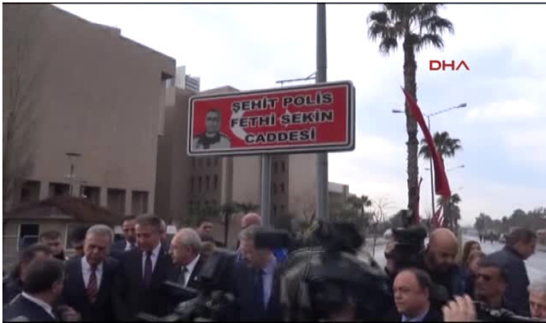
Resim 21 Fethi Sekin Caddesi https://www.haberler.com/izmir-chp-genel-baskani-kemal-kilicdaroglu-9230068-haberi/

Bu tarihten sonra pek çok kamusal alanda isim değişikliğine gidilmiş var olan tabelalar 15 Temmuz gecesini hatırlatacak isimlendirmelerle yeniden değiştirilmiştir.