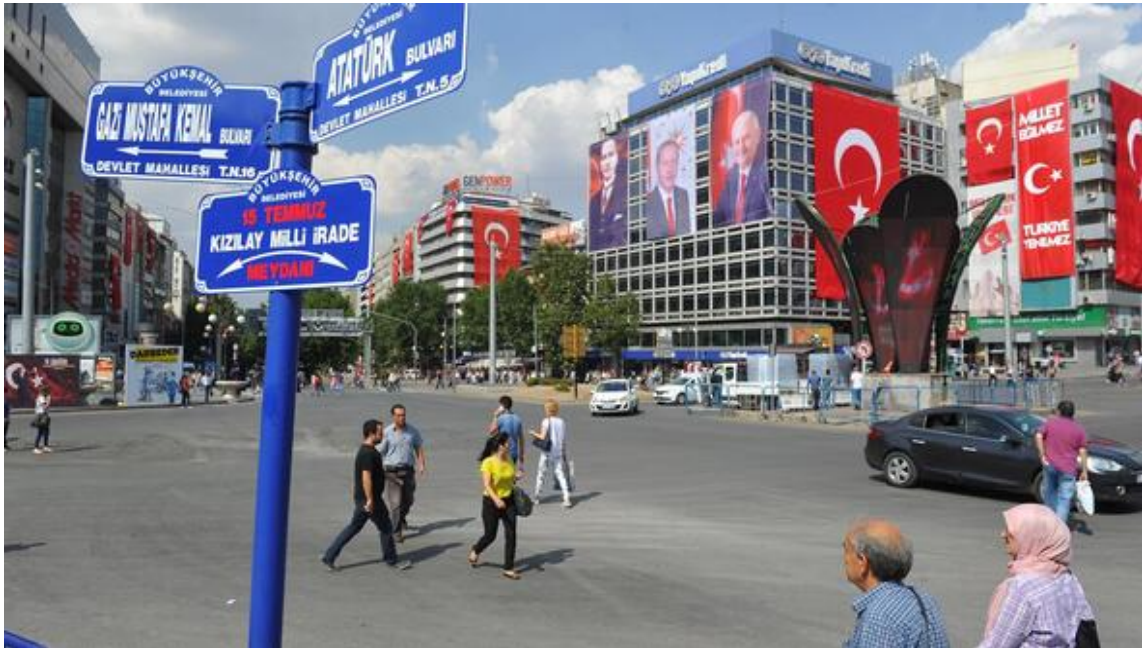
Resim 19 Atatürk Bulvarı

Caddeler ise bir kitap, bir edebiyat bir masal gibidir. İçinden geçilen caddeler de hayal kurulmamışsa, düşleri süslememişse eğer o caddeler sıra sıra dizilen vitrin ve dükkânlardan başka bir şey ifade etmemektedir (Taşdelen, 2017, s. 258). Bu noktada Cumhuriyet rejimi kendi ideolojisini ve isimlerini yaşatmak için caddelere, okullara, mahallelere, meydanlara uygun isimler vermiştir. Kazım Karabekir Caddesi, Hürriyet Mahallesi, Atatürk Bulvarı, Atatürk Caddesi gibi isimler aşağı yukarı her ilimizde mevcuttur. Diğer devletlerde ve diğer rejimler de konu bu durumdan farklı değildir.