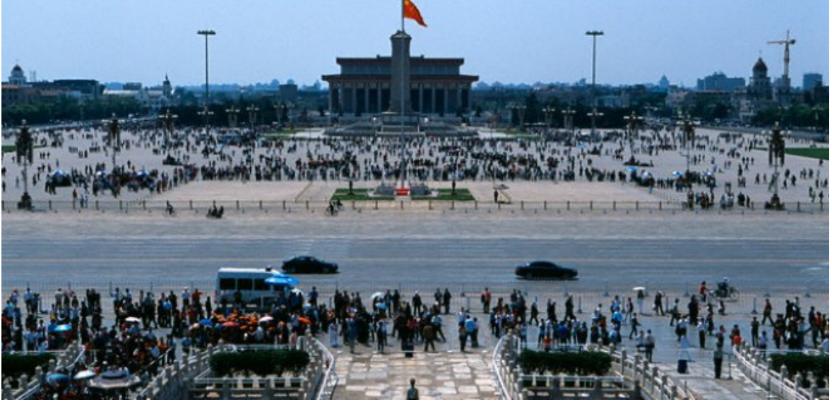
Resim 17 Tinananmen Meydanı Pekin

sembolü olmuştur (Taşçı, 2014, s. 218). Bu olaylar ve protestolar sonucunda ülkede sıkıyönetim ilan edilmiş ve askerinin açtığı çapraz ateş sonrası iki bine yakın kişi hayatını kaybetmiştir.