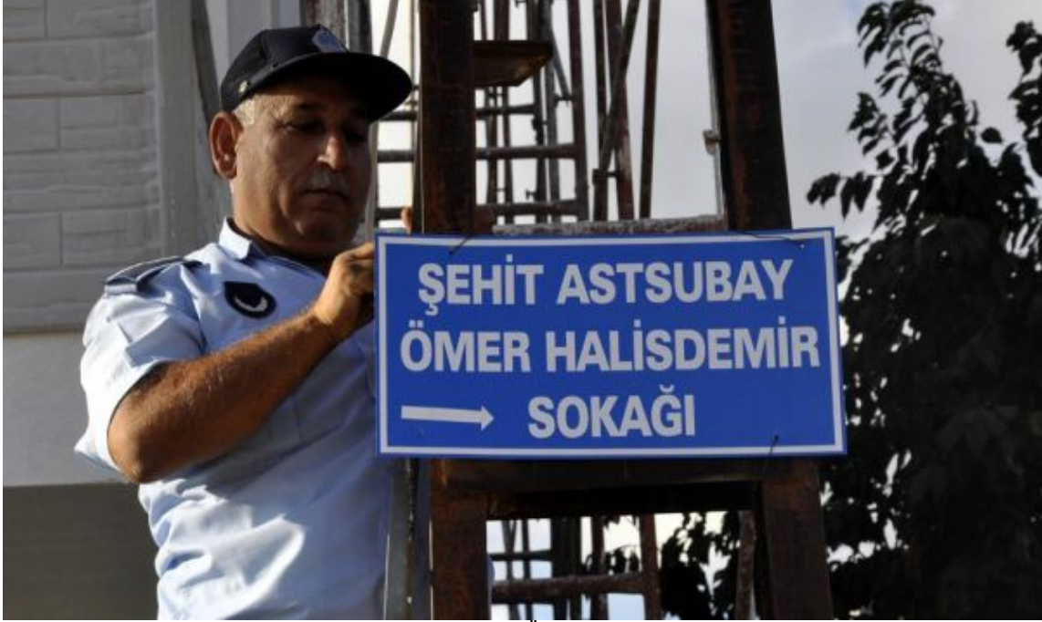
Resim 22 Şehit Astsubay Ömer Halisdemir Sokağı

Kent mekânlarında yapılan bu deęişiklik iktidarların kent mekânlarını unutturmak ve hatırlatmak için etkin biçimde kullanmakta olduklarını ispatlar niteliktedir.