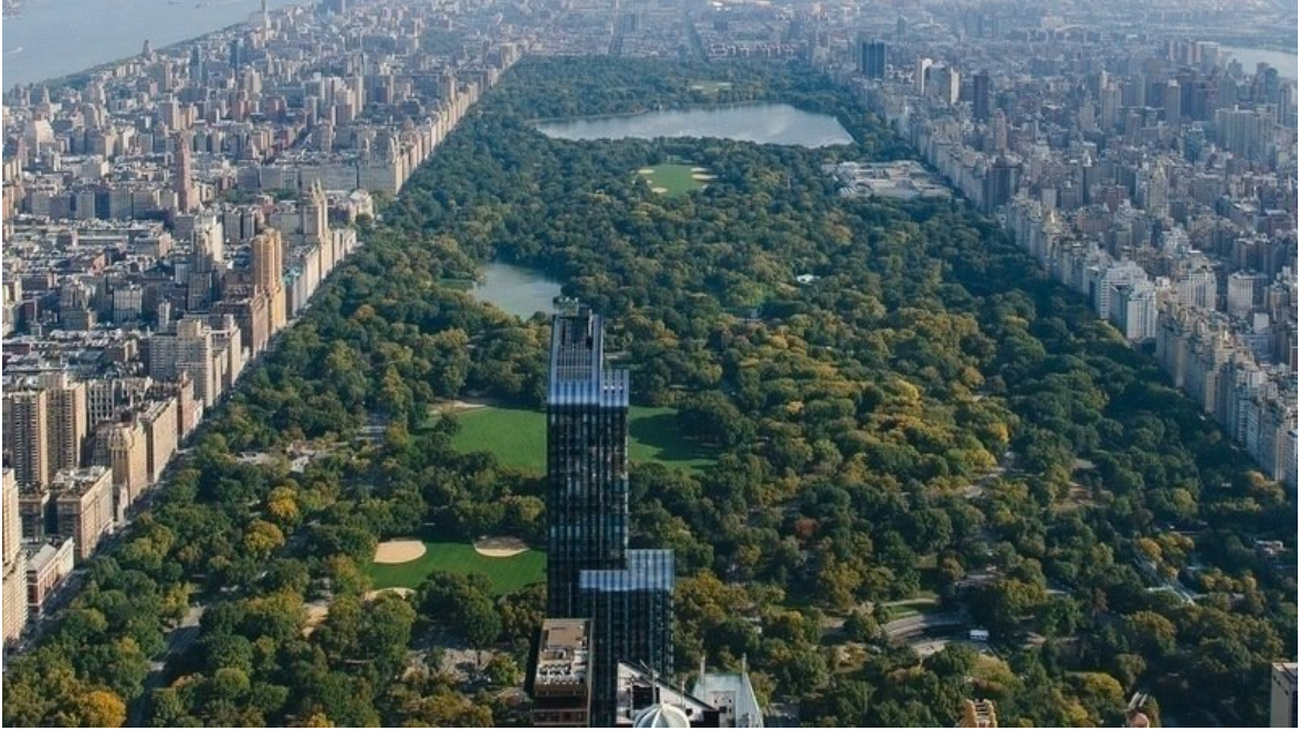
Resim 31 Central Park

https://www.change.org/p/atat%C3%BCrk-havaliman%C4%B1-central-park-gibi-olmal%C4%B1