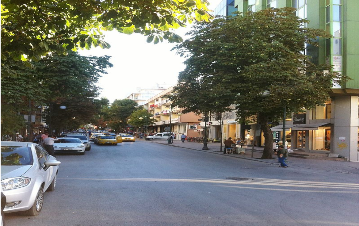
Resim 24 Tunalı Hilmi Caddesi

https://tr.wikipedia.org/wiki/Tunal%C4%B1_Hilmi_Caddesi