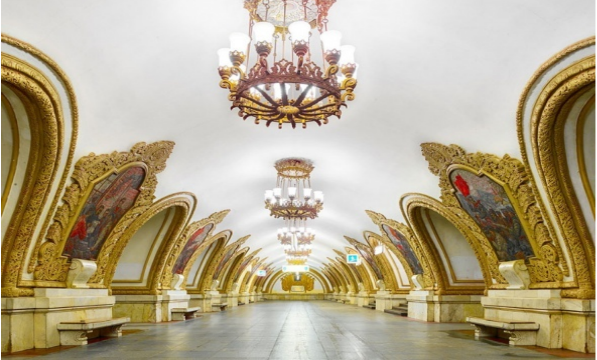
Resim 7 Moskova Metroyu

inşasına başlanan metro, Sovyet ideolojisinin, Sovyet sanat ve mimarisinin mekâna yansımasıdır.