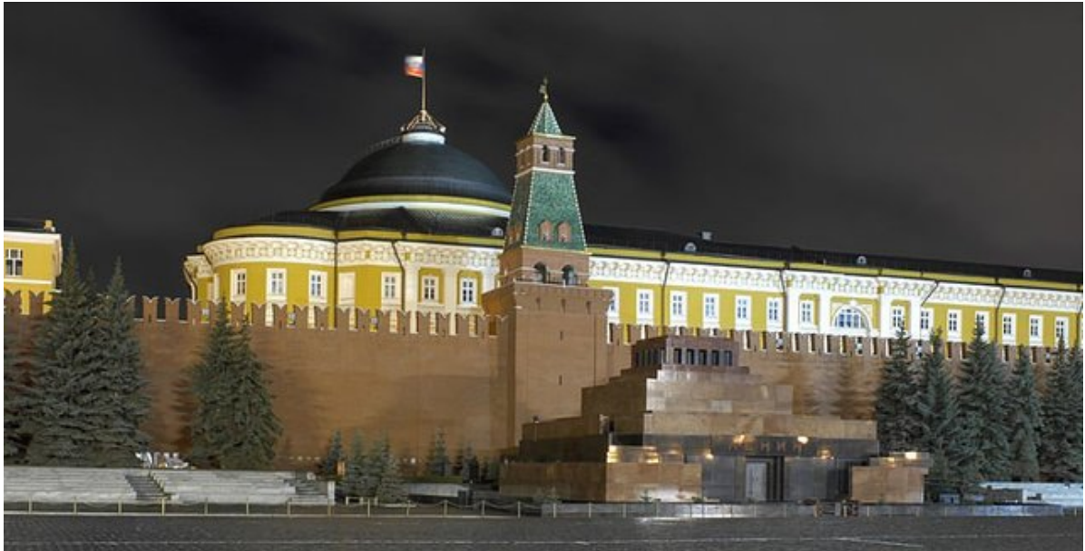
Resim 32 Lenin Mozolesi – Rusya

Dünyanın pek çok ülkesinde anıt mezarlar inşa edilmiştir. Çalışma kapsamında sadece bunlardan bir kaçı ele alınarak ideolojilerin anıt mezarlardaki yansımaları örneklendirilecektir.