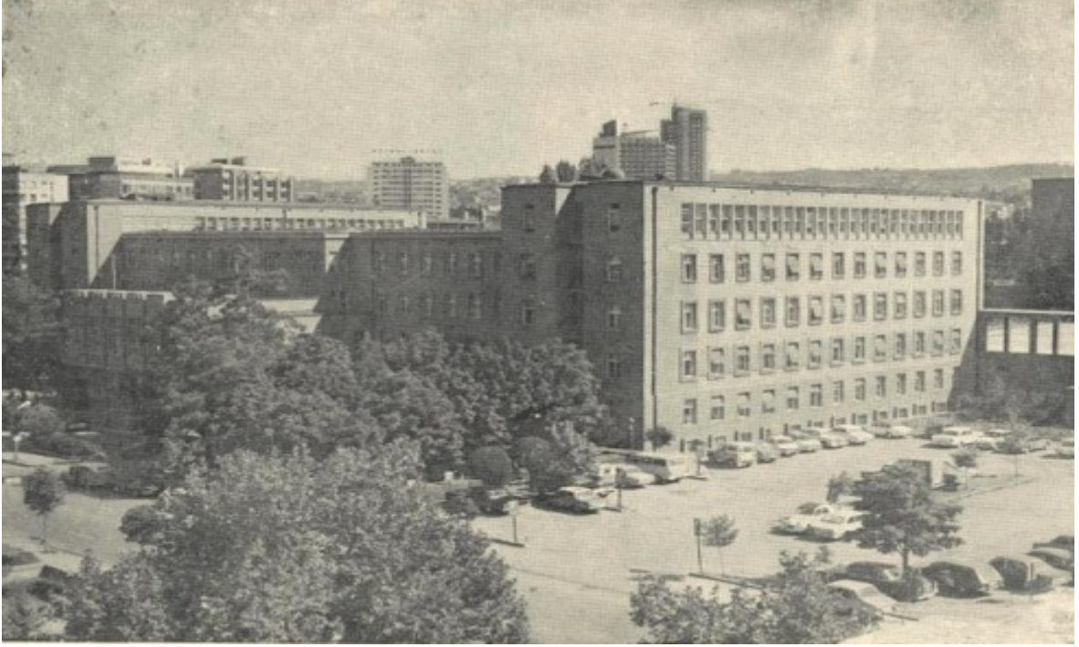
Resim 4 Bayındırlık Bakanlığı https://www.arkitera.com/haber/gecmisin-modern-mimarisi-ankara-1/

Yeni Türkiye'nin 1923 devrimi ulus devlet projesinin ilk adımı olarak tanımlanmıştır. Bu yüzden yeni rejimin kimlik oluşturma savaşı bir dizi inkılâp içermektedir. Osmanlının heterojen kimliği yerine homojen bir kimlik ile geçmiş ve geleceği bağdaştıran yeni bir kimlik üretilmelidir. Bu bağlamda modernleşme ve ulusallaşma projesi kapsamında sosyal, politik ve ekonomik ilkelere yönelik kararlar alınmıştır (Yalım, 2017, s. 167).