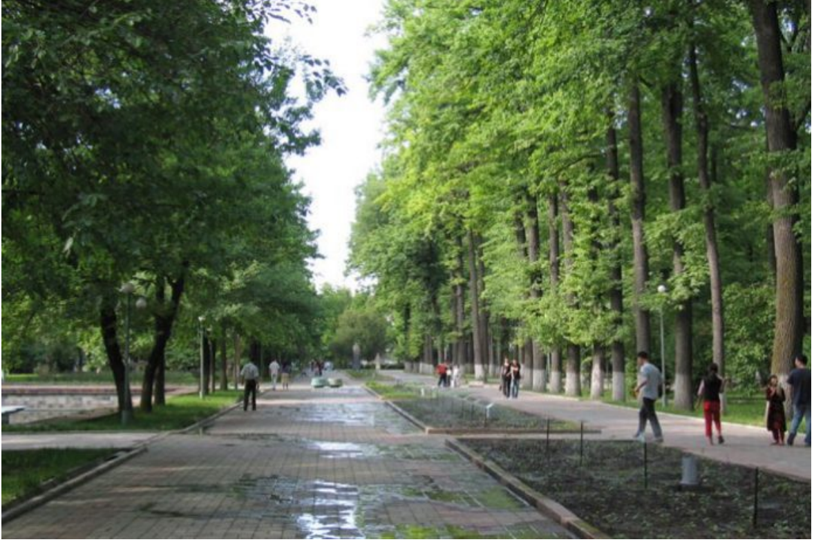
Resim 9 Sovyet döneminden kalma bir park olan, Oak Park (Meşe Parkı)

SSCB dağıldıktan sonra özgürlüğüne kavuşan ülkeler, SSCB'den kalan anıt ve heykelleri kamusal alandan kaldırarak, yerine yeni iktidarı, yeni rejimi ve ulusu simgeleyen anıt ve heykelleri kamusal alanlara dikmişlerdir (Ayhan, 2018, s. 50). Bişkek'de 1991 yılında özgürlüğüne kavuştuktan sonra artık kendi sembollerini kent mekânlarına yerleştirmiştir. Manas Heykeli, Ala Too Meydanındaki at üzerindeki heykel ki, bu heykel Lenin'in heykelinin yerine sonradan Kızgızlarca dikilmiştir. Bu da göstermektedir her iktidar kendi mekânını var etmekte, önceki iktidara ait izleri silmektedir.