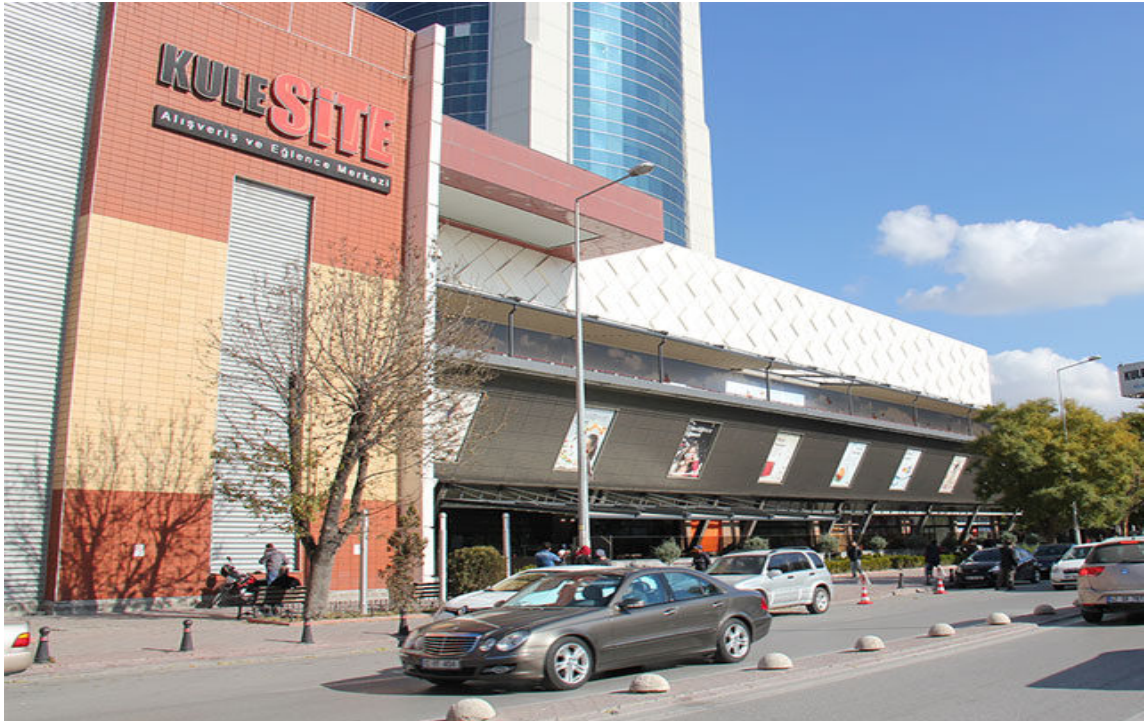
Resim 26 Konya Kulesite Alışveriş Merkezi https://avmdergi.com/kulesite-yenilendi/

Yine alışveriş merkezleri hayatı kolaylaştıran kredi kartlarını, modern ödeme tarzı olarak insanların hayatına soktuğundan beri konforun ve alışverişin kapısı girmek isteyen herkese açık hale getirilmiştir. Buralarda günlük yaşam baştan aşağı yapay olarak yeniden oluşturulmuştur. Gerginliklerden uzak soyut bir mutluluk vaat ederek insanları kendine çekmiştir. Eğlence, doğa, kültür gibi aranılan özellikler buralarda birleştirilip hepsi bir arada insanlara sunulmuş, onların hoşça vakit geçirmesi için her şey planlanmıştır (Baudrillard, 2012, s. 21).