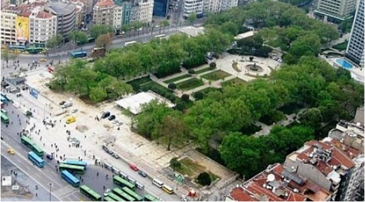
Resim 18 Taksim Gezi Parkı

https://www.sozcu.com.tr/2016/gunun-icinden/gezi-parki-projesinde-neleri-kapsiyor-topcu-kislasi-nedir-neden-onemli-1282511/