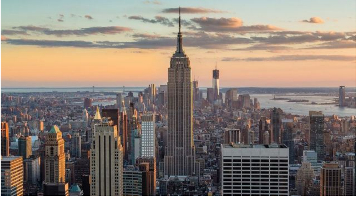
Resim 12 Empire State https://www.arkitektuel.com/empire-state-binasi/

New York'un önemli bir simgesi de 1886 yılında Fransızlar tarafından Amerikan halkına hediye edilen Özgürlük Heykeli'dir. Heykelin tepesindeki özgürlük meşalesi Amerikan halkının konukseverliğinin yanında, ekonomik gücün, ticari, mali ve sınai nüfuzun meydana çıkardığı manzarayı da aydınlatmaktadır. Heykel daha geniş bir ufka bakabilmek için sırtını kente dönmüştür. Aynı zamanda New York ve Londra'nın dünya üzerindeki egemenlik yarışının da bir simgesi olarak kabul görmektedir.