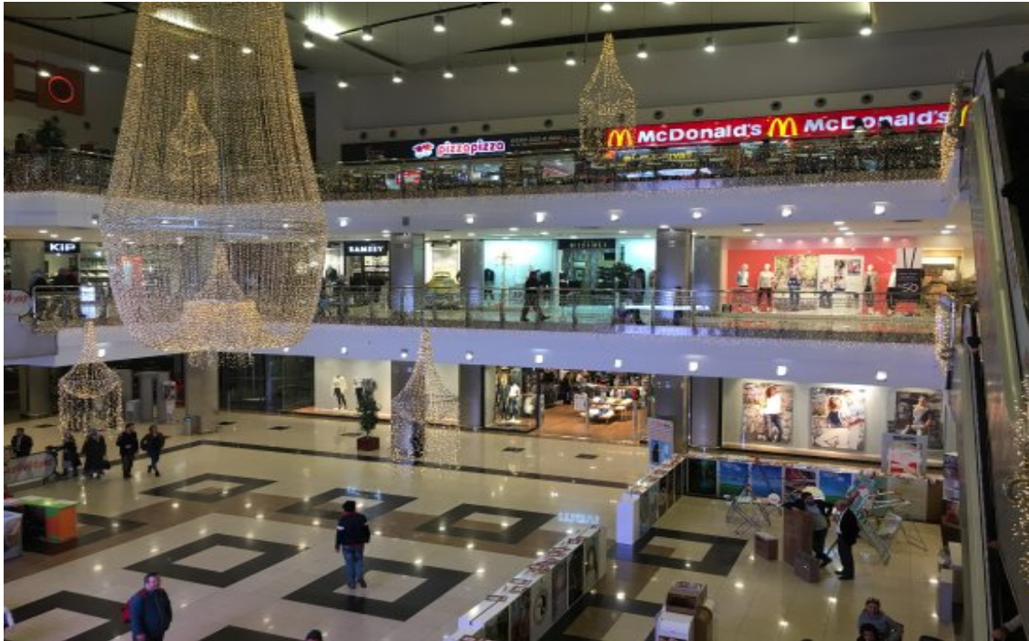
Resim 27 Konya Kulesite Alışveriş Merkezi

Rahatsız edici kişilerden, dilencilerden, aylaklardan arındırılan devamlı gözetim altında tutulan tüketim tapınakları ziyaretçilerine dışarıdan tamamıyla izole edilmiş bir mekân sunmaktadır. Alışveriş önce mekân içinde, sonra zaman içinde sunulan bir yolculuk olmaktadır (Bauman, 2017, s. 151-152).