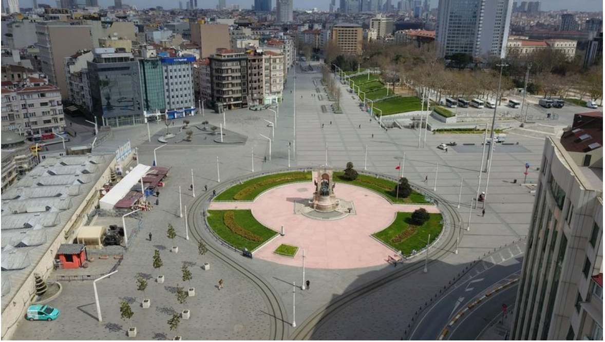
Resim 14 Taksim Meydanı

https://www.haberturk.com/son-dakika-haberler-taksim-meydani-ve-istiklal-caddesi-ndeki-son-durum-havadan-goruntulendi-2639595