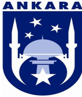
Resim 2 Yeni Ankara Amblemi

http://www.diken.com.tr/ankaranin-yeni-belediye-baskani-hitit-gunesine-donmeyi-gundemine-aldi/