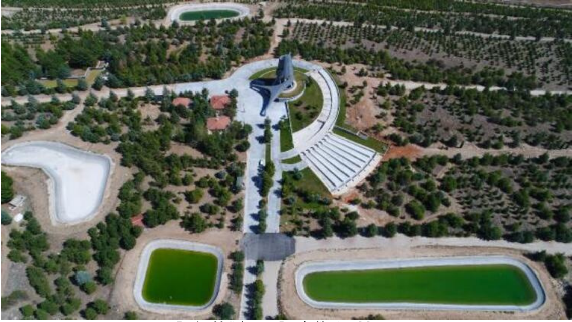
Resim 33 Süleyman Demirel'in Anıt Mezarı

https://www.hurriyet.com.tr/gundem/demirelin-anit-mezari-ziyarete-acildi-41338233