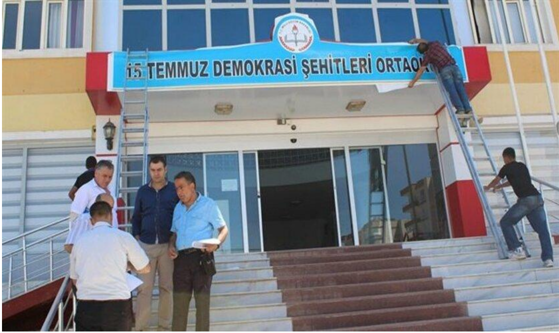
Resim 20 15 Temmuz Demokrasi Şehitleri Ortaokulu https://www.yenisafak.com/gundem/fe-tonun-okuluna-15-temmuz-adi-verildi-2502680

Bu tarihten sonra pek çok kamusal alanda isim değişikliğine gidilmiş var olan tabelalar 15 Temmuz gecesini hatırlatacak isimlendirmelerle yeniden değiştirilmiştir.