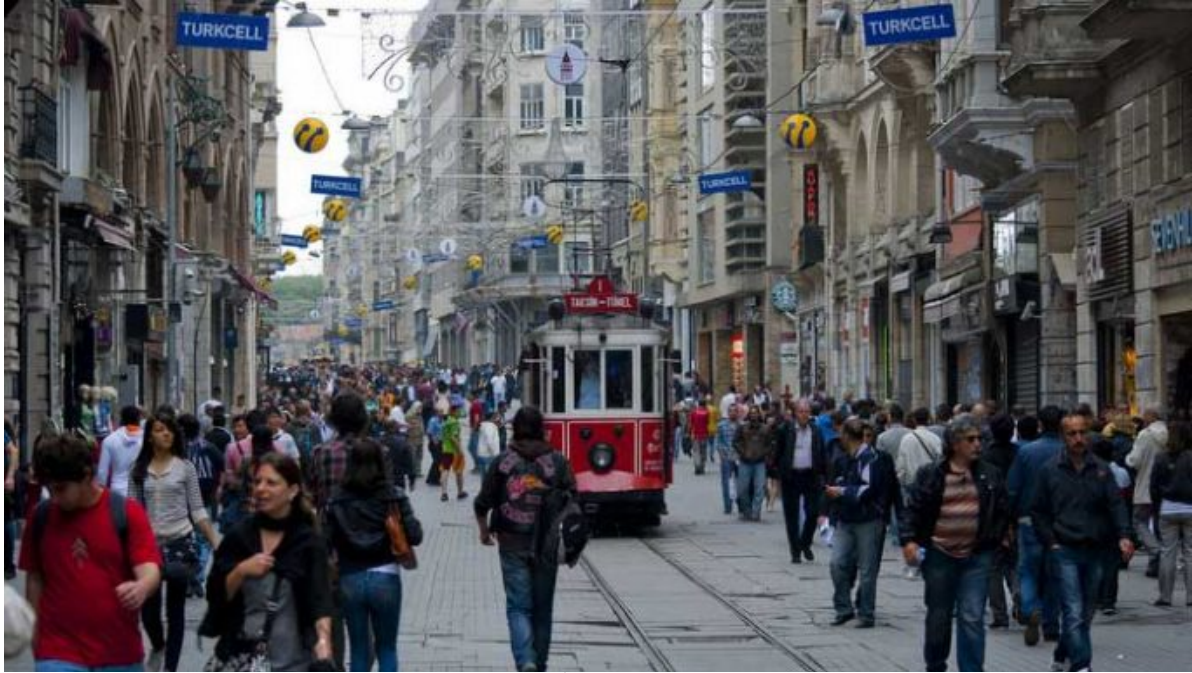
Resim 25 İstiklal Caddesi http://gezilecekyerler.com/istiklal-caddesi/

Sonuç itibariyle isimlendirme ideolojik, politik bir anlam taşımaktadır. Modern dönemlerin siyasallaşan mekânları ideolojik söylemler içermektedir. İktidar ideolojilerini etkin bir şekilde iletmenin bir yolu olan isimlendirme, millî bir tarih, millî bir ruh oluşturma ve toplumu hâkimiyeti altına alarak yeni bir kimlik oluşturma amacı gütmektedir. Her iktidar kendinden önceki dönemin izlerini silmeyi ve kendi tarihini yazmayı arzulamaktadır. Bu sebeple de mekâna müdahale etmeyi, hem yasallaştırmakta hem de kendine hak olarak görmektedir.