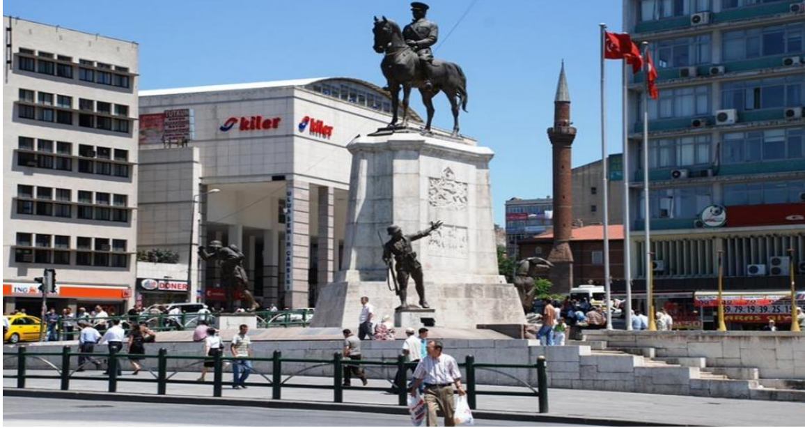
Resim 5 Ulus Meydanı Yeni Ankara

bir kadındır (Yalım, 2017, s. 202-203). Bu nedenle Zafer Anıtı'ndaki o kadın Anadolu kadınıdır.