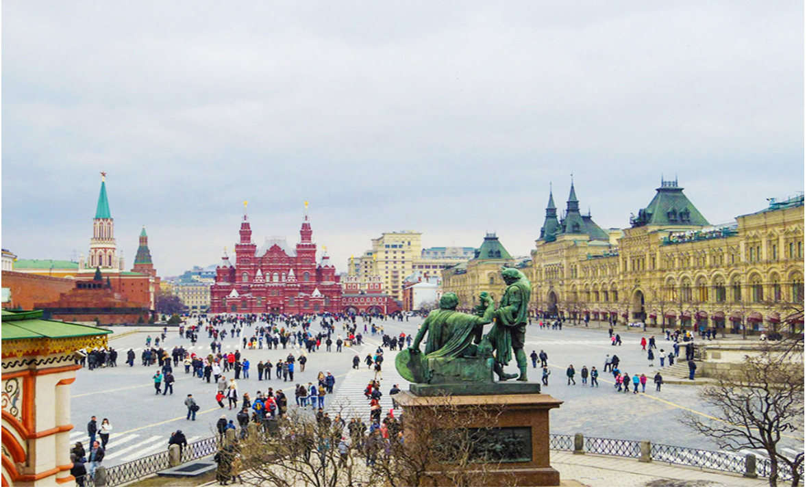
Resim 8 Moskova Kızıl Meydan

İdeolojik başkentlere bir örnek de Kırgızistan'ın başkenti Bişkek'tir. Bişkek komünist ideolojinin mekânda yansıması en çok hissedilen başkentlerden biridir. Anıtsal yapılarıyla ünlü Bişkek Sovyetler Birliği' nin izlerini taşımaktadır. Geniş yol ve meydanlar, birçok anıt, Sovyet tarzında blok halinde inşa edilmiş konutlar ve büyük yeşil bir alandan oluşan parklar.