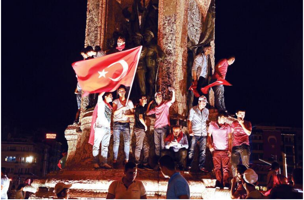
Resim 15 Taksim Meydanı 15 Temmuz Darbe Girişimi Sonrası https://www.hurriyet.com.tr/yasasin-demokrasi/meydanlarda-darbe-ofkesi-40163885

ülke geneline yayılmıştır. Bu darbeyi unutturmamak adına da darbeyi hatırlatıcı ideolojik isimlendirmeler hem meydanlara hem de cadde ve sokaklara verilmiştir.