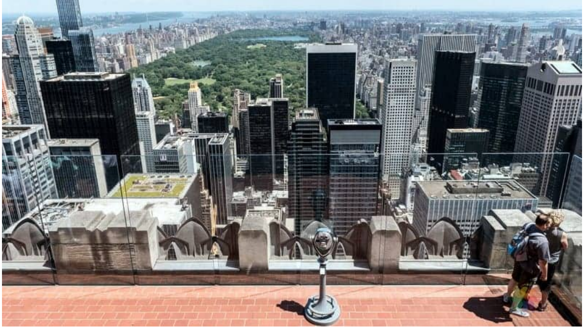
Resim 11 Rockefeller Center

ekonomik gcn, parasal hâkimiyetin ve kresel ve kapitalist kentlerin gstergesidir. Bu gkdelenlere birkaç grsel eklemek gerekirse Őphesiz bunlardan biri Rockefeller Center'dır. New York'un Manhattan semtinde yer alan bir iŐ merkezidir.