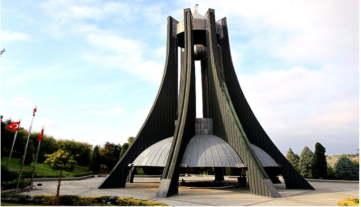
Resim 34 Turgut Özal'ın Anıt Mezarı

https://www.ntv.com.tr/galeri/turkiye/ozalin-mezari-yeniden-ziyarete-acildi,WtZNLDRM60K-