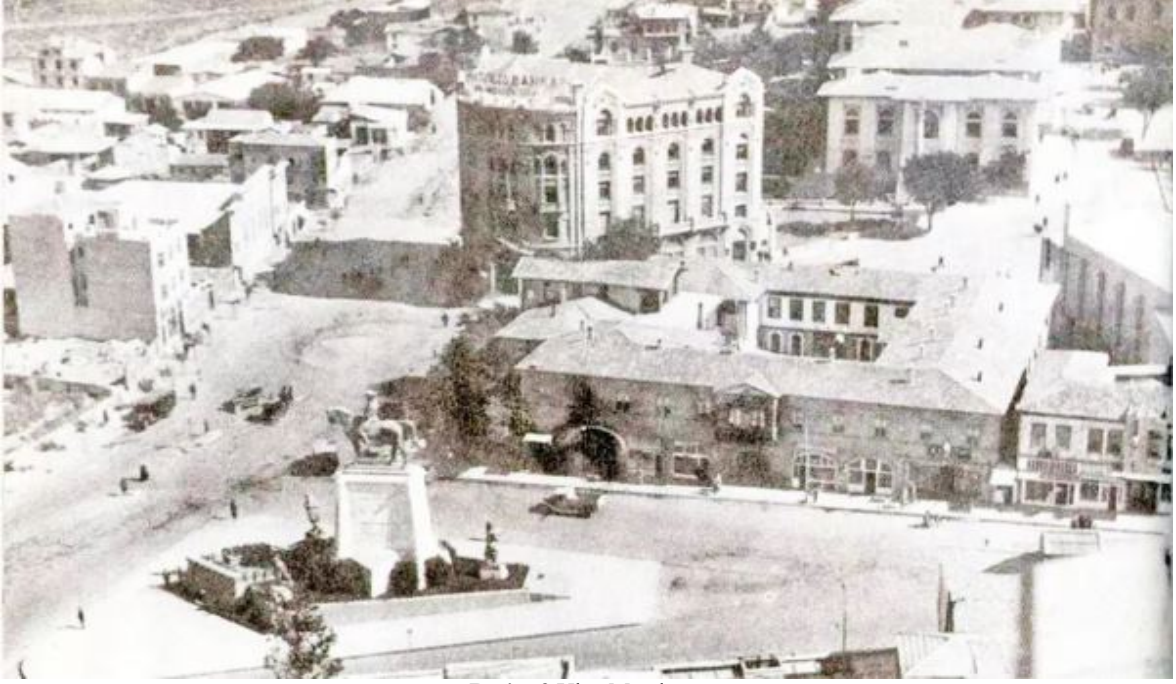
Resim 3 Ulus Meydanı

http://mimdap.org/2018/09/tarih-ycinde-ankaranyn-kalbi-ulus/