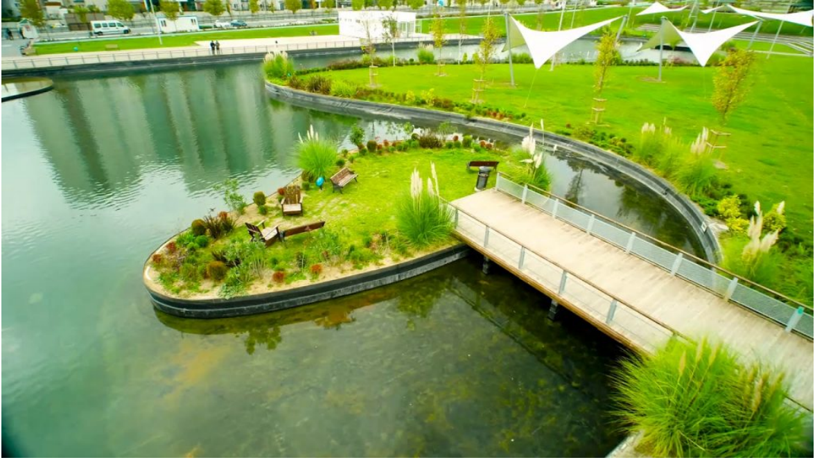
Resim 30 Nakkaştepe Millet Bahçesi

Yine dünyadan millet bahçelerine bir güzel örnekte ABD'den Central Parktır. Central Park ABD'nin New York Şehrinin Manhattan İlçesinde üç yüz kırk bir hektarlık bir alan üzerinde yer alan büyük bir parktır. Geçmişî bataklık, taş ocağı ve gecekondular olan bir alandan 1858 yılında düzenlenerek bugünlere gelmiştir. Birçok bitki çeşidini içerisinde barındırmakla birlikte pek çok sportif etkinlik için ayrılmış alanları da bulunmaktadır. Bunların yanında hayvanat bahçesine, gösteri alanlarına, müzeye, tiyatroya da sahiptir (Sağlık & diğerleri, 2019, s. 15). Farklı yaş gruplarından kullanıcılara hitap eden park herkesi kucaklamaktadır. Hem şehrin merkezinde bulunmakta da hem de tüm kullanıcılarına huzur dağıtmaktadır. Kendinden sonra gelen birçok parkında prototipi niteliğindedir. Farklı mimari biçimleri de içerisinde muhafaza eden Central Park, tarihten bugüne kentin birçok estetik değerini, sembol ve simgesini taşıma görevini üstlenmiştir. Siyasi olarak da iktidarın kontrol alanı olarak görevini tamamlamıştır (Başaran, 2020, s. 135-142).