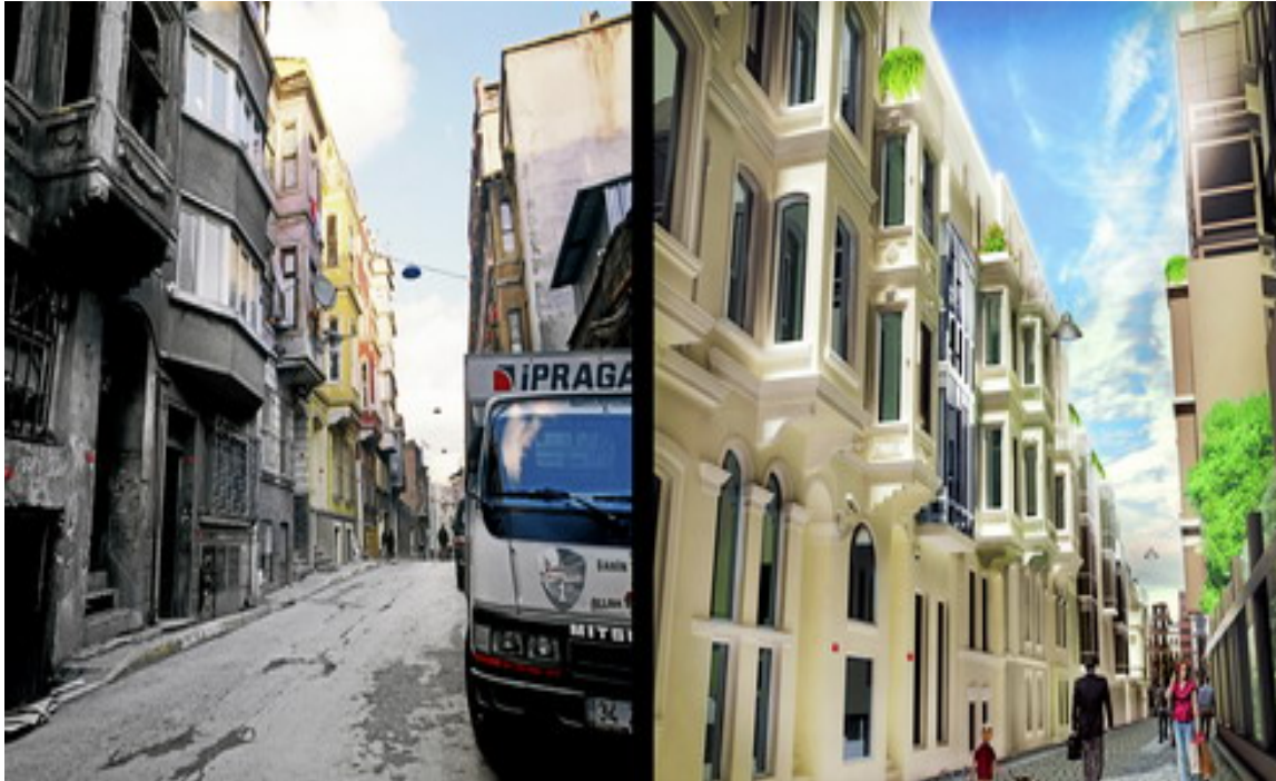
Resim 28 Tarlabası Kentsel Dönüşüm

zenginleşmiş, mağazası, kafesi ve sokaklarıyla eski izbeliğinden eser kalmamış ve pırıl pırıl imajıyla; yeni bir imge oluşturulmuştur. Geçmişten ilham alarak yeni bir Tarlabası inşa edilecektir. Fakat yapılanlar göstermektedir ki Tarlabası'nın 150 yıllık tarihi yerle bir edilmiştir. Üstelik “Yeni Tarlabası umuttur.”, “Yeni Tarlabası gelecektir.” gibi sloganlarla eski Tarlabası'nı sadece umutsuzluk yoksulluk ve tekinsizlikle özdeşleştirmiştir. Tüm bir mahalle yaşantısını yok sayan iktidar; meşrulaştırdığı hayalini, kurduğu bu imgeler üzerinden gerçekleştirmiştir. Yani Taksim 360 Projesi dev panolarla arka planda gerçekleşen acıyı, çaresizliği, yıkımı ve şiddeti gizlemiştir (Acun, 2019, s. 124-127). Bütün bu görsele oynayan argümanlar ve malzemeler modern dönem iktidarlarının sır ve giz perdesini oluşturmaktadır.