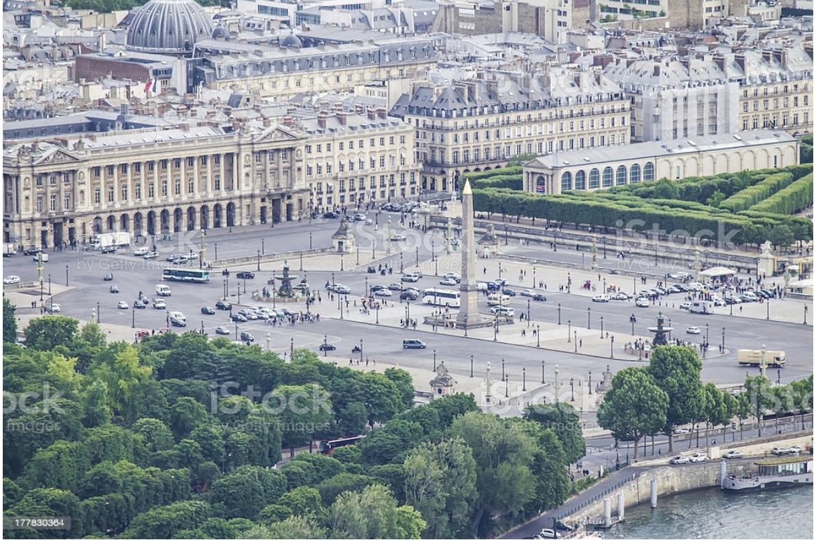
Resim 16 Concorde Meydanı Paris

gerçekleştirilmektedir. Fransız İhtilali'ne zemin hazırlayan Bastille Günü etkinliklerinin adresi de yine bu mekândır. Kısacası Concerde Meydanı siyasi olaylarla iç içe olmuş ve siyasi kimlik kazanmış bir meydandır.