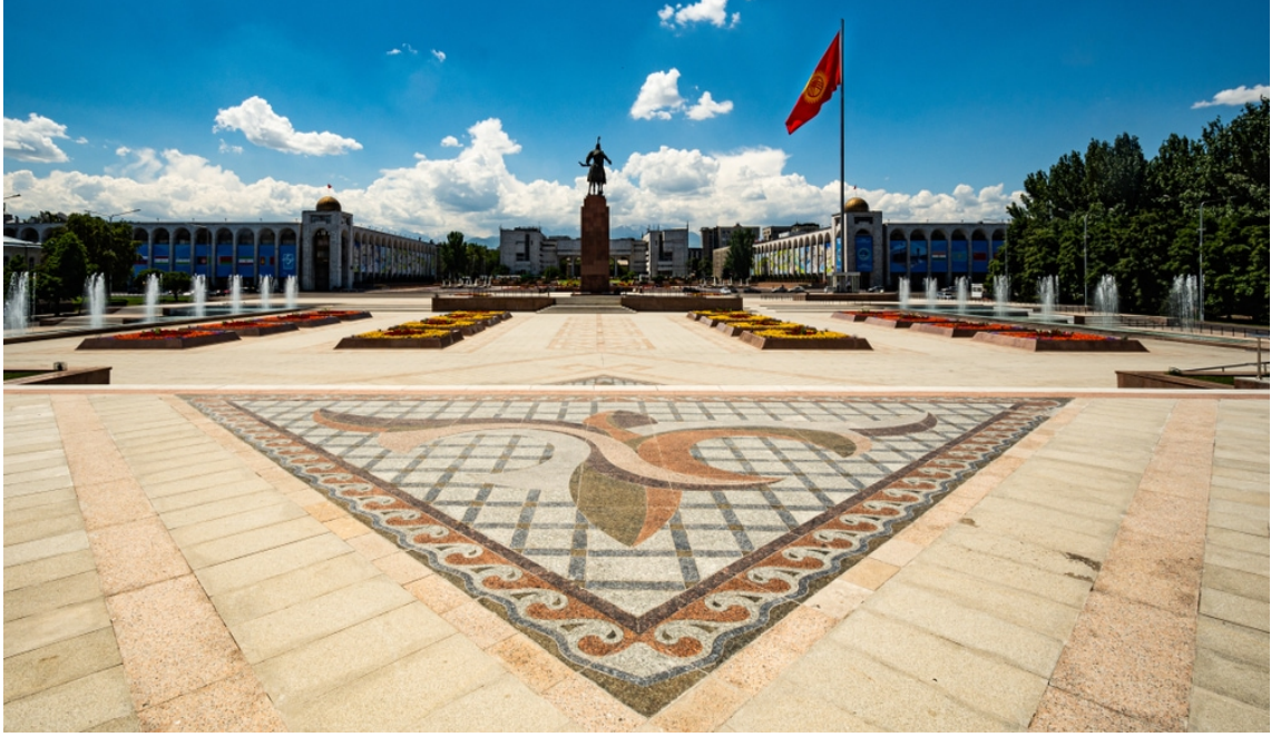
Resim 10 Bişkek Ala Too Meydanı

Kırgızistan'ın özgürlüğünü eline almasıyla birlikte değişen iktidar, komünist sistemden liberal sisteme geçmiştir. Bu tarihten sonra da şehrin çehresi değişmeye başlamıştır. Artık kamusal alanlarda Sovyet ideolojisine ait sembollerin yerini, Kırgızların tarihine ve kültürlerine ait simge ve semboller almıştır. Sovyet yönetimince değiştirilen cadde ve sokak isimleri de Kırgız ideoloji çerçevesinde yeniden elden geçirilmiş ve değiştirilmiştir. Bişkek sokaklarında, artık Rusça değil, Kırgız Türkçesi konuşulmaya başlanmıştır (Ercilasun, 2014, s. 391-393).