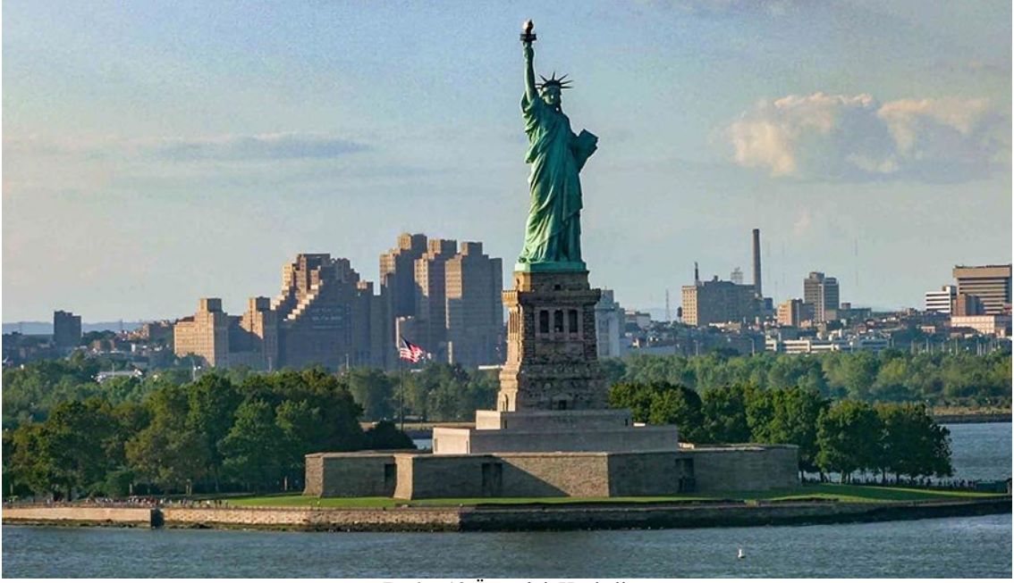
Resim 13 Özgürlük Heykeli

https://www.sozcu.com.tr/hayatim/seyahat/osmanlidan-abdye-ozgurluk-heykelinin-hikayesi/