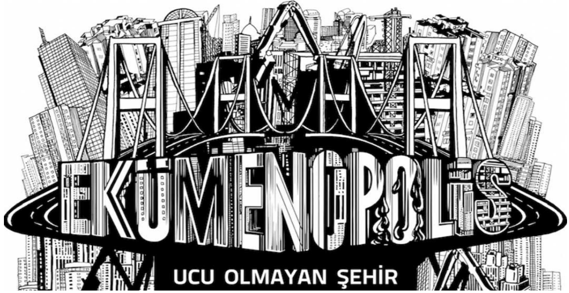
Resim 29 Ekümenopolis Film Afişi

https://romankahramanlari.com/degisen-bir-sehrin-belgeseli-ekumenopolis-ucu-olmayan-sehir/