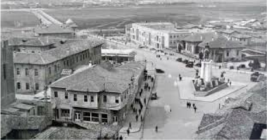
Resim 6 Ulus Meydanı Eski Ankara

mekânları kullanım değerinden çok değişim değerine emanet edilmiştir. Ki bu süreç de 2003 yılından sonra Adalet ve Kalkınma Partisi iktidarı döneminde uygulanan hükümet politikaları ve kentsel dönüşüm ile birlikte gerek Ankara gerek diğer kentlerde hızlı bir dönüşüm ve değişim sürecini başlatmıştır. Kentsel dönüşüm politikaları kentin varsılları ve yoksulları arasında belirgin bir çizgi oluşturmuş, toplumu sınıflara bölmüştür. Kolektif tüketim yerine kimine sosyal yardımlar kimine rantsal kazançlar dağıtmakta ve kamusal alan ortadan kaldırılmaktadır. Artık birçok yapı ve mekâna kaynak gözüyle bakılma durumu; kenti tarihinden koparmakta, kamusal alanları yok etmekte, kimliksiz mekânlar ve toplumlar oluşturmaktadır. Neoliberal politikalarla birlikte ivme kazanan alışveriş merkezleri, gökdelenler, kapalı siteler ve otobanlar Ankara'nın hafızasını yeniden inşa etmektedir (Dursun & Poyraz, 2014, s. 62-85).