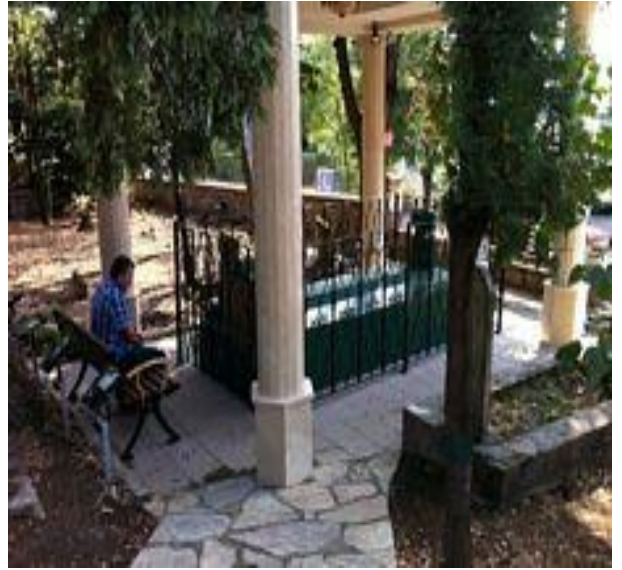
b- Ebu Derda Türbesi