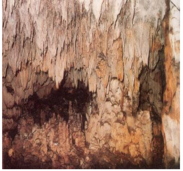
b- Gürcüoluk Mağarası