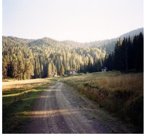
b- Arıt Vadisi