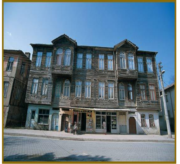
b- Tarihi evler