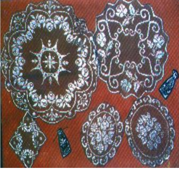
Foto9: a- Bartın Tel Kırma