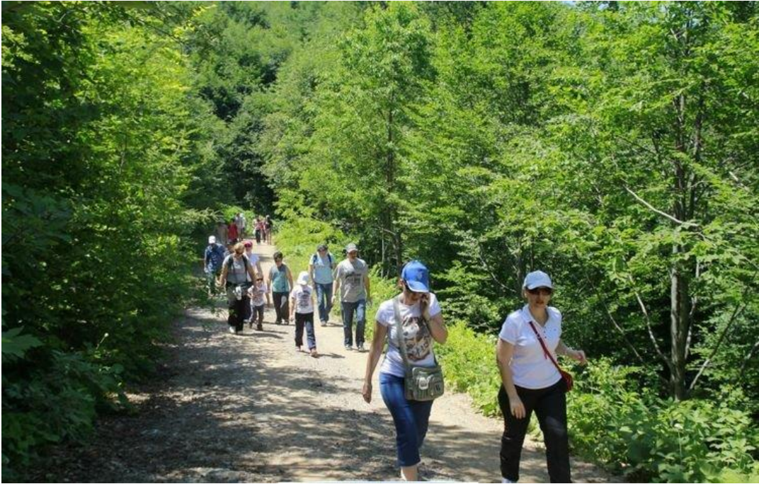
Şekil 5: Bartın Gezen Yaylası

Yayla Turizmi: Bartın 'da, Uluyayla, Ardıç ve Gezen yaylaları olağanüstü güzellikler sergileyerek yayla turizmi için önemli bir potansiyele sahiptir.