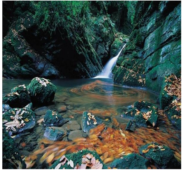
b- Kumluca Aksu Şelalesi