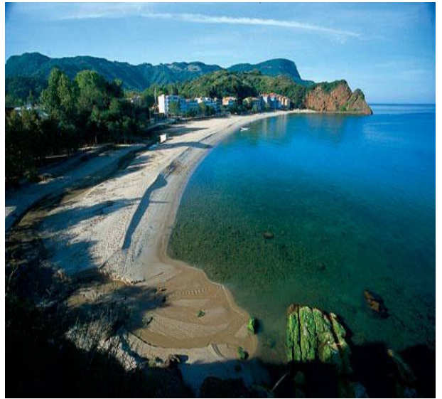
b- İnkum plajı