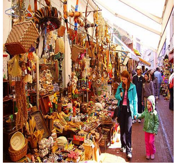
b- Amasra Çekiciler Çarşısı